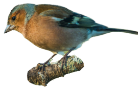
Pinson des arbres