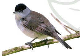
Fauvette à tête noire