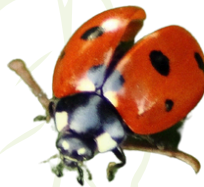
Coccinelle à 7 points et sa larve